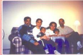
Son-in-law, daughter Daughter-in-law and Son with grand children