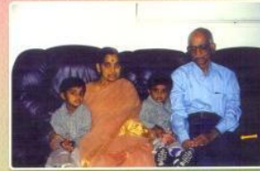
With grand children